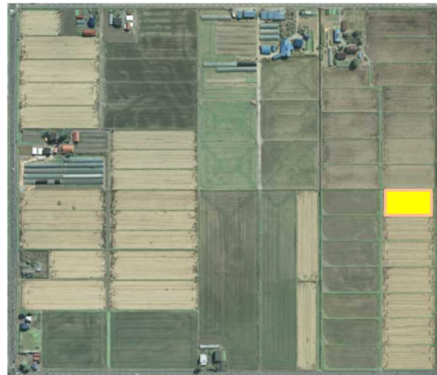
整備前 (現況区画 0.3ha~0.5ha)