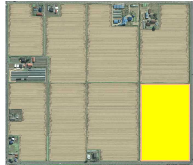
整備後イメージ (標準区画 2.2ha)