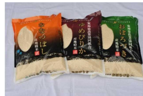
東神楽産ブランド米

東神楽町産のお米は、JAひがしかぐらの栽培基準を定め全量一等米の安心・安全で高品質な東神楽産ブランド米（ななつぼし・ゆめぴりか・おぼろづき）として全国へ流通しています。