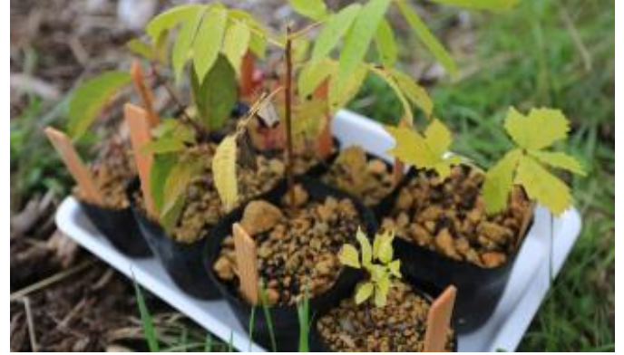
サンル川周辺の野山からとった種を苗木に育て これまで23,900ポットを植樹しています