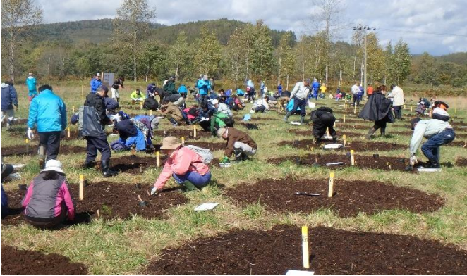
昨年の植樹会の様子（約170名参加）