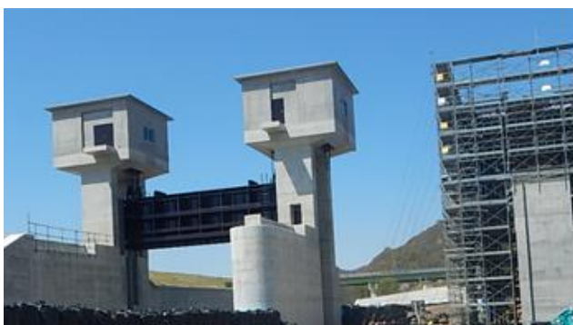
ウップetz川水門工事現場状況（R1. 6）撮影