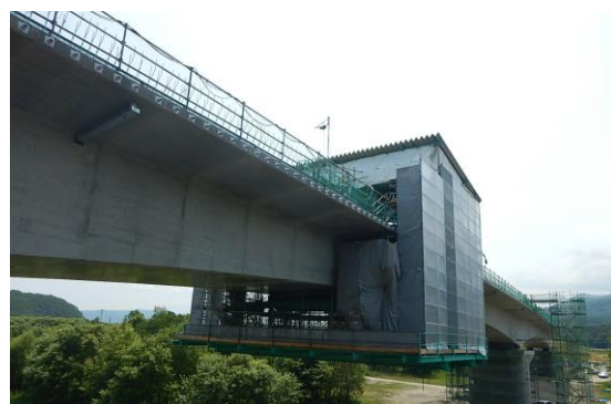
新富良野大橋上部工事現場状況（R1. 7）撮影