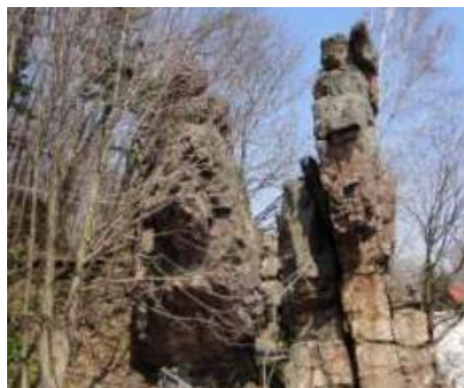
ジオパークサイト候補地（立岩）