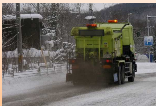
＜凍結防止剤散布車＞

凍結防止剤散布車により、交差点部などのツルツル路面において凍結防止剤（塩化ナトリウム等）や防滑材（砂）を散布します。