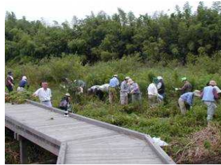
ビオトープの整備