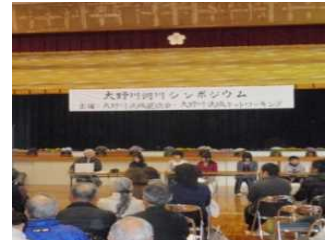
シンポジウムの開催