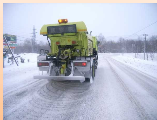
<凍結防止剤散布車>

凍結防止剤散布車により、交差点部などのツルツル路面において凍結防止剤（塩化ナトリウム等）や防滑材（砂）を散布します。