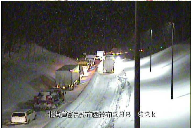
北海道富良野市西達布R38 92k

【迂回路】 国道38号～国道237号～国道39号～旭川紋別自動車道(E39)～国道333号～国道242号～国道241号～国道274号