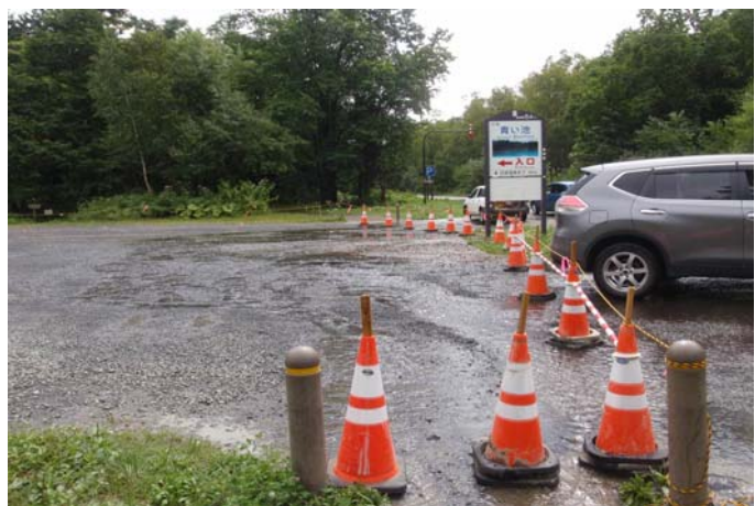
砂防施設(通称「青い池」)の立ち入り制限の状況

砂防施設パトロールにより被災を確認。 施設入口にセーフティーコーンを設置し、立ち入りを制限しています。