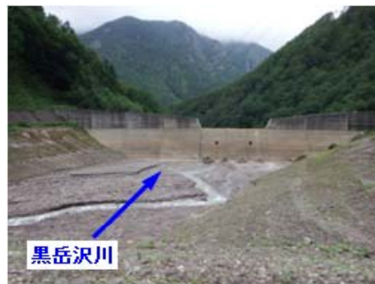
土石流発生前全景

黒岳沢川で発生した土石流を堰堤で捕捉することにより、 下流の層雲峡温泉街の被災を防ぎました。