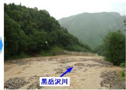
土石流発生後全景