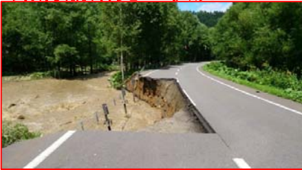
R273 路肩崩落発生状況