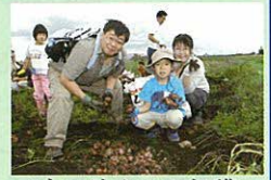
ジャガイモの収穫

春に親子でまいた種が成長し、秋になってそれを収穫できる喜びは家族の絆を深め、子どもたちの良い思い出になったことでしょう。大好評につき、来年度も開催を予定しています。