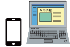
ホームページ Twitter、メール

とくべつけいほう ・【特別警報】が発表されたら 非常事態です。ただちに命を 守る行動をとりましょう。