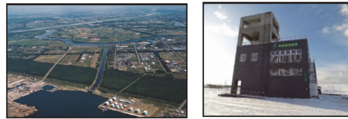
ほうすいる 放水路