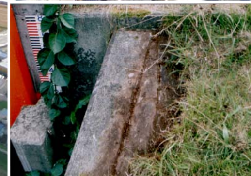
コンクリートの老朽化