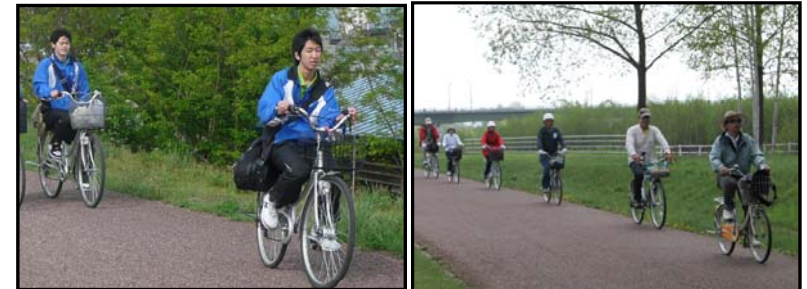
平常時 サイクリング・マラソン・通学