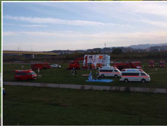
防災ヘリ(旭川医大緊急搬送)