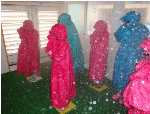
降雨体験装置で大雨を体験

この防災講座は、旭川市等により今年2月に設立された「あさひかわ子どもの水辺協議会」の活動として実施されました。旭川河川事務所も、市内全域の子どもたちへ河川についての理解を深めていただくため、積極的にこの取組に参画しています。