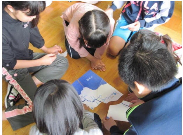
パズルによる川の学習

この防災講座は、旭川市等により今年2月に設立された「あさひかわ子どもの水辺協議会」の活動として実施されました。旭川河川事務所も、市内全域の子どもたちへ河川についての理解を深めていただくため、積極的にこの取組に参画しています。