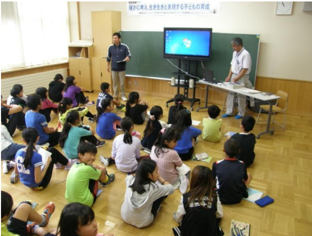
事務所職員による河川と防災の説明

9月30日(火)、旭川市立青雲小学校のご依頼で、5年生の皆さんに旭川河川事務所の職員による出前講座を実施しました。青雲小では、理科の授業の「ながれる水のはたらき」で、河川と暮らしが取り上げられていることから、身近な石狩川のさまざまな機能や、防災に関する地域の取組などについて、職員が分かりやすく説明しました。