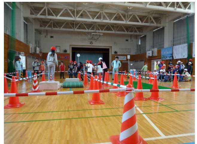
避難体験シミュレーション