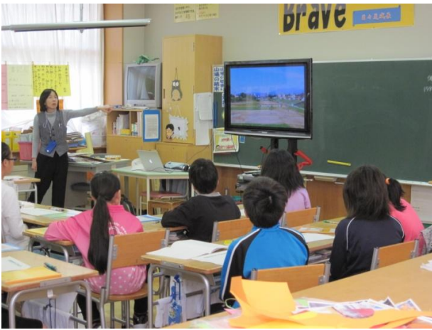
防災講座を受ける5年生

10月1日(水)、旭川市立新町小学校5年生が参加して、旭川市公園緑地協会による防災講座が開かれました。旭川河川事務所では出前講座として職員による洪水○×クイズや、降雨体験と避難体験を行いました。旭川を流れる「石狩川とその支川」のコーナーでは、パズルを使った川の学習等も行われ、皆さん熱心に聞き入っていました。