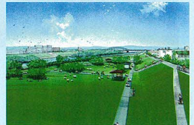
河川自由広場のイメージ②