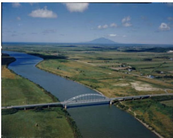
天塩大橋 (天塩町、幌延町)

著しい蛇行区間は多数の捷水路工事により直線化され、大小の旧川跡地(沼)が点在している。また、砂州変動の激しかった河口部は導流堤により、現在安定している。