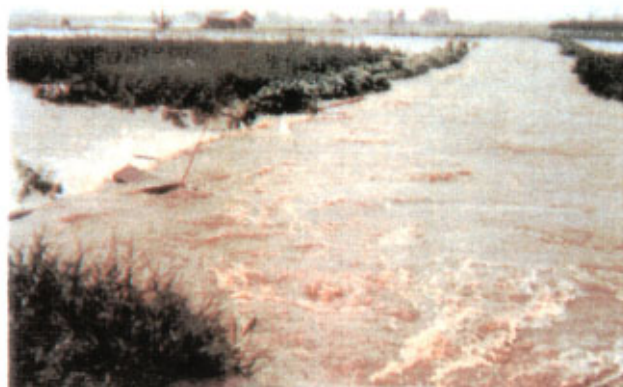
昭和48年8月洪水 (名寄市十線川の溢水氾濫状況)

上流域では国鉄名寄～美深間が冠水で不通となったほか、名寄川でも国鉄名寄～下川間が一部不通となり、床上浸水337戸、床下浸水1,123戸、全壊3戸、半壊3戸、田畑の浸水12,775ha、河川被害33ヶ所、道路決壊2ヶ所など、各地で甚大な被害が発生した。