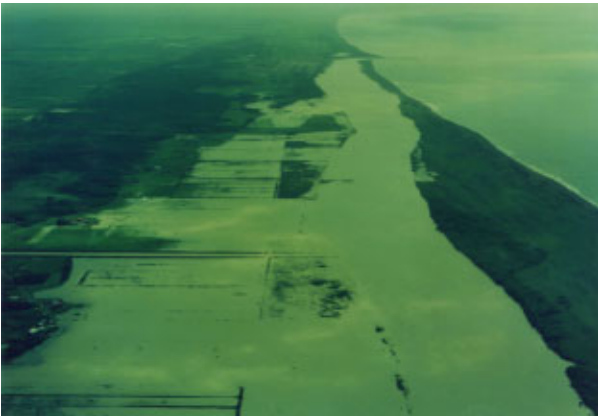
昭和 50 年 9 月洪水 (天塩川 北川口の溢水氾濫状況)

同年 9 月、低気圧による集中豪雨の影響で、天塩川下流域で氾濫し、家屋、道路、農地等に多大な被害をもたらした。