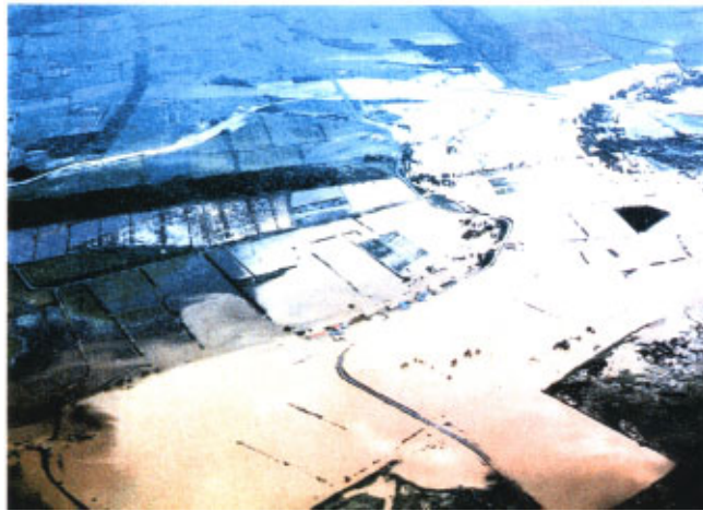
昭和 56 年 8 月洪水 (天塩川右支川サロベツ川左岸 幌延町南下沼地区の冠水した農家)

天塩町、幌延町では共に農作物で作付面積の 17%に当たる被害を被った。辰根牛地区などで土俵の水防活動が実施されたが、床上浸水 8 戸、床下浸水 34 戸、農地の被害は畑で 4,492ha、河川堤防損壊 3 ヲ所、道路橋梁損壊 2 ヲ所などの被害があった。