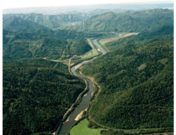
音威子府狭窄部 (音威子府村)