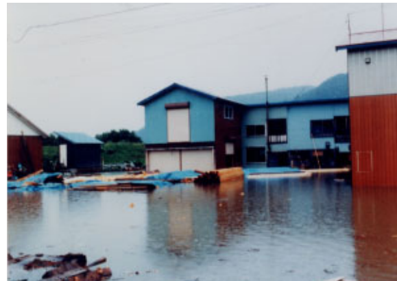
昭和 56 年 8 月洪水 (天塩川 音威子府市街の浸水状況)