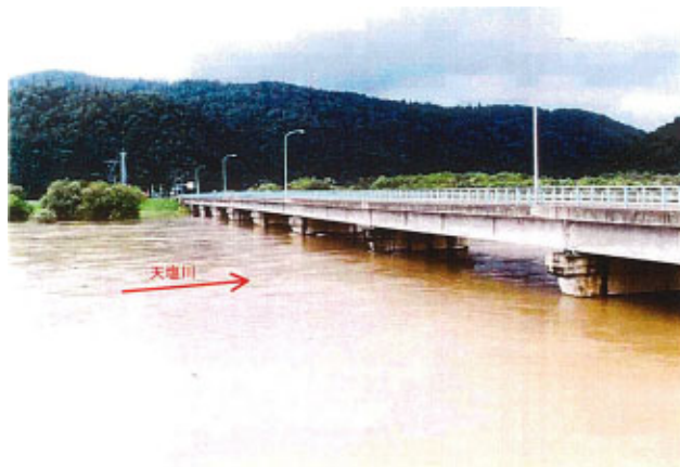
平成 6 年 8 月洪水 (天塩川 音威子府橋の洪水状況)