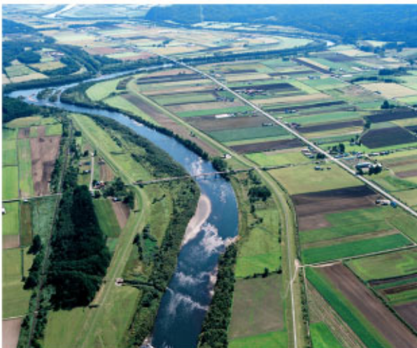
恩根内地先から上流 (美深町)

河岸土質は主にシルトであり、河床材料は砂礫であるが、所々に築のような形で横断している岩(テッシ)が露出している。このため、天塩川は全体的に河床低下傾向にあるが、智東の狭窄部から音威子府の区間においては河床低下がほとんど無い状態である。