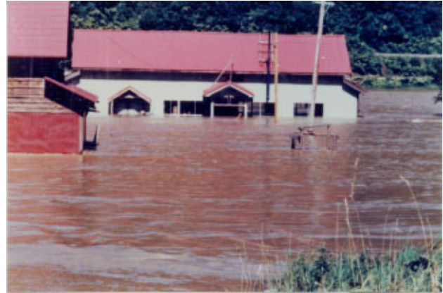
昭和 50 年 8 月洪水 (天塩川 音威子府村の浸水状況)