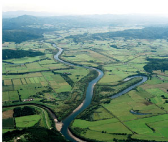
問寒別川合流点 (中川町、幌延町、天塩町)