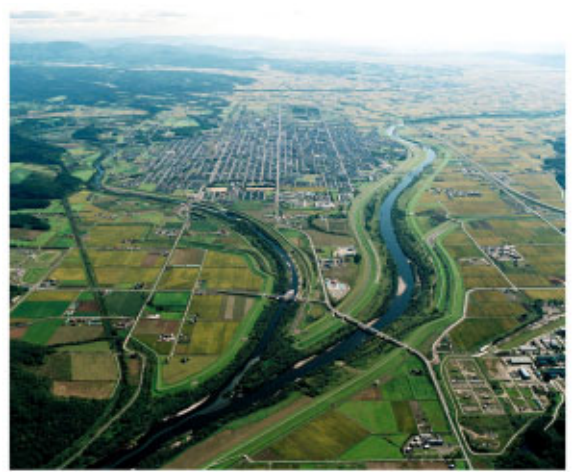
名寄市街地 (名寄市)