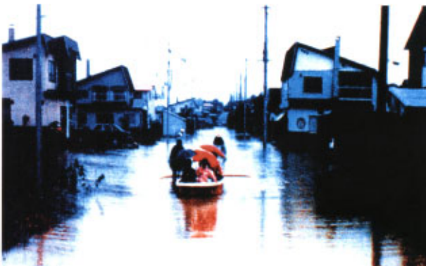
昭和 56 年 8 月洪水 (天塩川右支川名寄川 内水による 浸水のため住民避難 名寄市徳田白樺団地)

被害状況は、床下浸水 408 戸、床上浸水 73 戸、田・畑の浸水 14,108ha、土木被害は河川 187 ヲ所、道路損壊 147 ヲ所、橋梁損壊 18 ヲ所であった。また、浸水の恐れのある箇所等には土俵積、内水氾濫箇所ではポンプ排水を実施するなどし、それぞれ水防活動を行った。