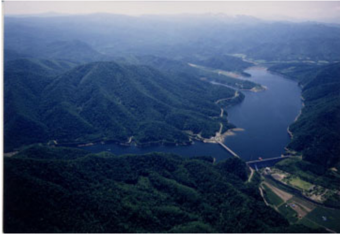
岩尾内ダム全景 (朝日町)

盆地周囲には砂礫質の台地や河岸段丘が発達し、河畔林が連続した自然河岸区間が多い。河床が砂礫で構成され、復列砂州が見られるが、河道は比較的安定しており、近年では砂州上に樹木の発達が多く見られる。