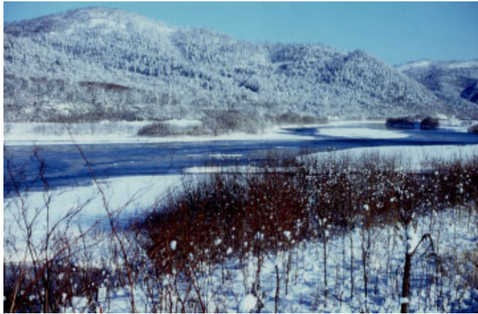
冬期に結氷する天塩川（中川地区）

一方、夏季の洪水は集中豪雨に起因する出水が多いのが特徴となっている。強い雨が降るのは限られた期間で、それは、本州の梅雨が終わる頃の7月初めと、オホーツク海高気圧により寒冷前線の発生する7月後半、あるいはシベリア高気圧により寒冷前線が南下する8月下旬の3種類が挙げられ、これに低気圧や台風が伴うと更に雨量はおおくなり、水害が発生している。