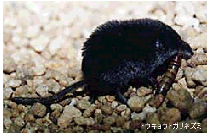
トウキョウトガリネズミ