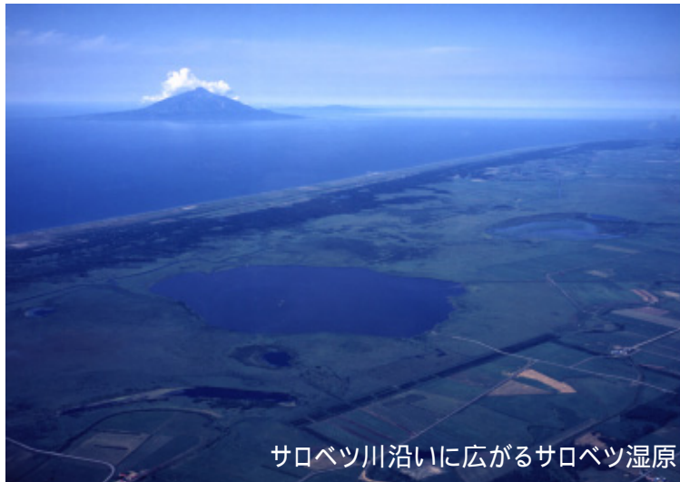
サロベツ川沿いに広がるサロベツ湿原