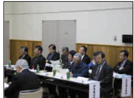
意見聴取会の状況