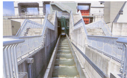
スイングシュート方式魚道ゲート