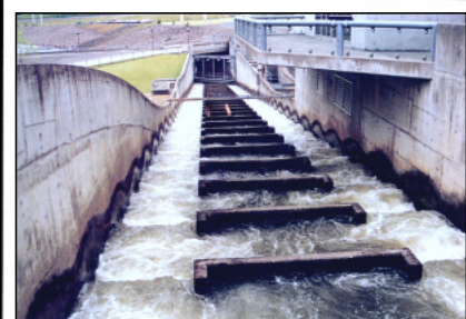
アメリカコロンビア川のボンビレーダムにおける階段式魚道