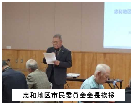
忠和地区市民委員会会長挨拶