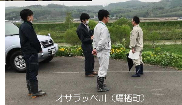
石狩川上流水防連絡協議会旭川地方部会 及び重要水防箇所合同巡視開催状況