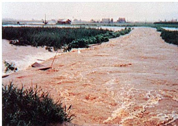
十線川の溢水氾濫状況(名寄市)