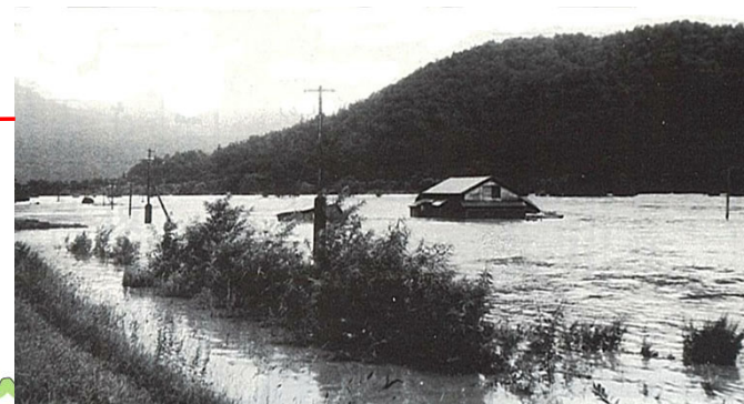
天塩川左岸の氾濫 (音威子府村物満内地先)