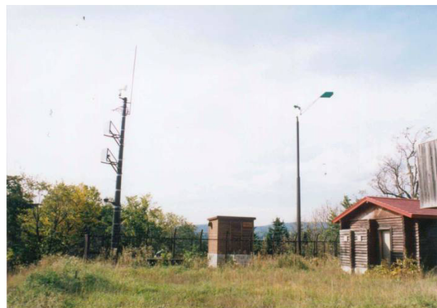
サンルダム気象観測所