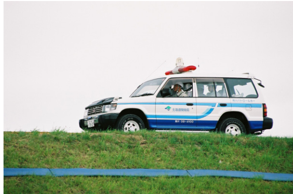
河川巡視イメージ