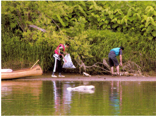
水面からの巡視イメージ