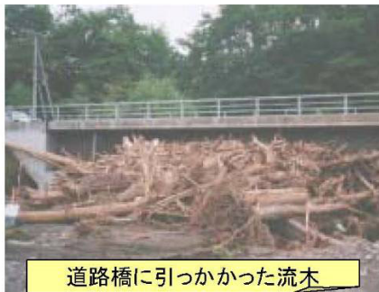
道路橋に引っかかった流木