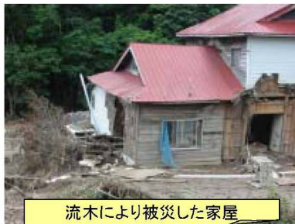
流木により被災した家屋