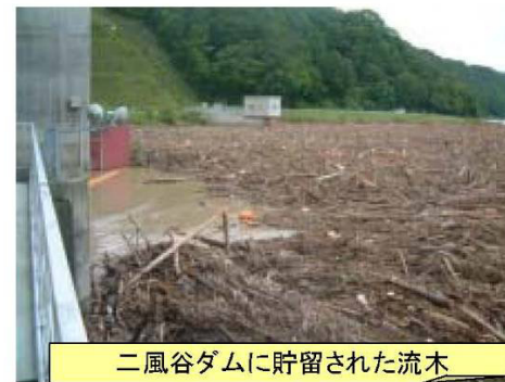
二風谷ダムに貯留された流木