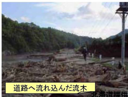
道路へ流れ込んだ流木