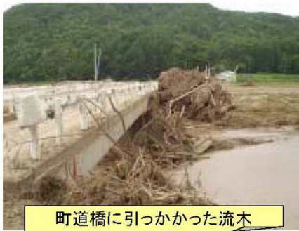
町道橋に引っかかった流木