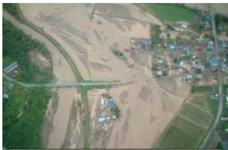
沙流川上流 堤防溢水・破堤により氾濫