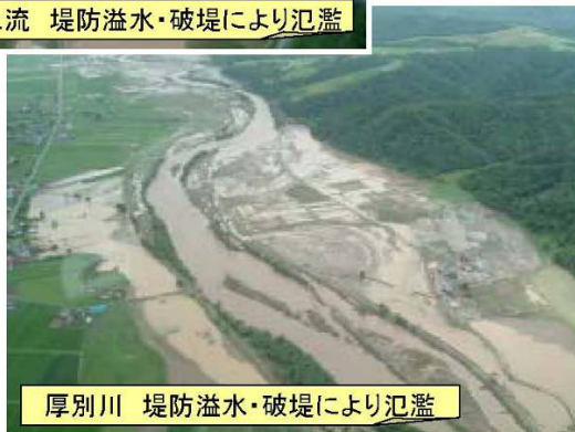
厚別川 堤防溢水・破堤により氾濫