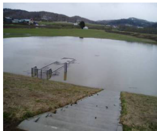
天塩川紋穂内地区浸水状況 平成18年5月11日午前撮影