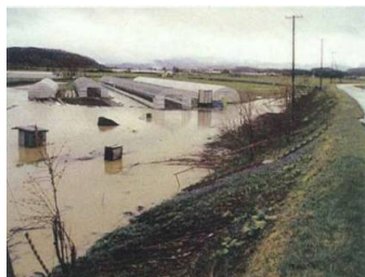
名寄川上名寄16線樋門地先浸水状況 平成18年5月11日午前撮影