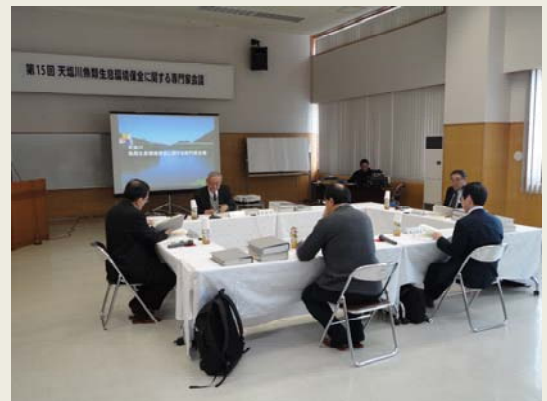
第15回天塩川魚類生息環境保全に関する専門家会議の様子

旭川開発建設部及び留萌開発建設部では、平成19年10月に天塩川水系河川整備計画が策定されたことを踏まえ、天塩川流域における魚類等の移動の連続性確保及び生息環境の保全に向けた川づくりやモニタリング等について、魚類等に関する学識経験や知見を有する専門家の方々の意見を聴取するため、平成19年11月14日に設置しました。