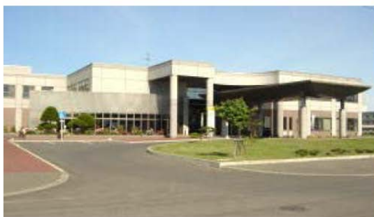
【名寄市総合福祉センター】