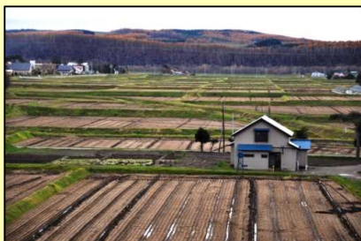
30～50aの小区画ほ場が地区内の9割を占め、機械作業の効率が悪い

しかし、地区内の農地は、小区画、排水不良等のほ場条件に加え、離農跡地の継承による経営耕地の分散化が進んでいることから、農作業効率が悪く、農業生産性の向上を図るうえで支障を来しており、現在の生産基盤のままでは、将来的に担い手への農地流動化が困難となり、地域では農業者の高齢化、後継者の不足等から耕作放棄地が増加するおそれがある。