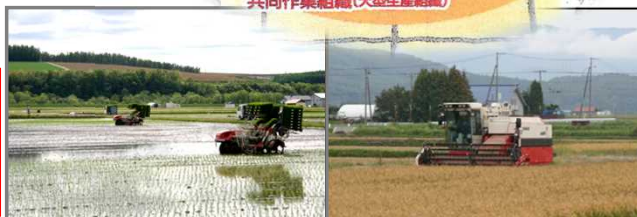
ほ場の大区画化と併せて共同作業を行うことにより、 「東川米」を低コスト安定生産が可能

生産基盤の整備と併せて、 これら取組みを推進すること で高品質・安定生産による 地域ブランドを強化