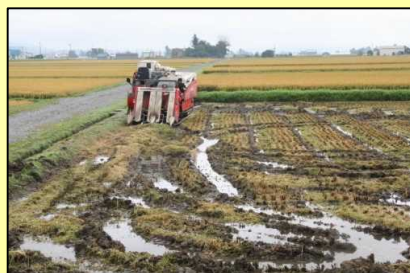
排水不良なほ場では機械がぬかるみやすく、作業効率が悪い