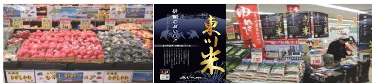
「ひがしかわサラダ」、「東川米」の全国販売を拡大 (左は神奈川県、右は新潟県での販売の様子)