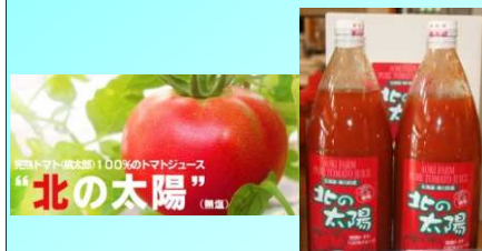
東川町産の完熟トマト(桃太郎)100% トマトジュース「北の太陽」