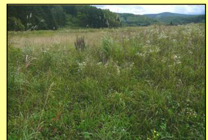
地区内では耕作放棄地が発生