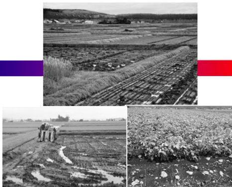
小区画・排水不良・石礫過多のほ場条件 では作業効率が悪く、生産性も低い