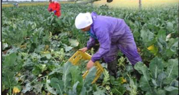
地域住民を雇用し、ひがしかわサラダ (写真はブロッコリー)を収穫

生産基盤の整備と併せて、 これら取組みを推進すること で高品質・安定生産による 地域ブランドを強化