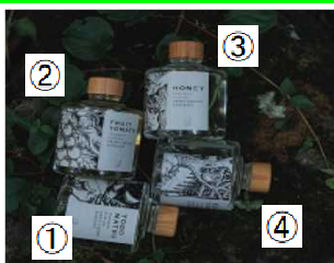
①トマト、②フルーツマト ③HONEY、④ミックス

下川町農林養蜂業自体のブランド化を目指し、如何なる状況においても生き残れる農林養蜂業を確立し、産業間の課題に着目して未知の領域の解決手法(=未知のビジネスモデル)を実践し、社会ニーズに合う解決手法を農林養蜂業に提示し、共に解決発展を目指しております。