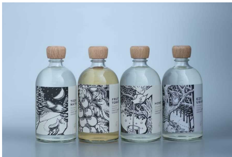
EZOUSAGI (クラフトジンリキュール)