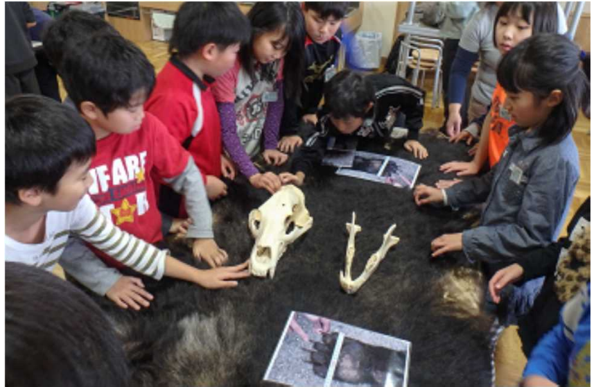
旭川市内小学生に出前授業でヒグマの生態や特徴を説明