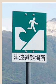
(Nơi lánh nạn khi xảy ra Sóng thần)

Ở khu vực gần bờ biển có đặt các biển báo nơi lánh nạn giúp mọi người lánh nạn khi xảy ra Sóng thần