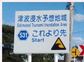
(Từ chỗ này trở đi là khu vực được dự báo sẽ ngập nước khi Sóng thần tràn vào)