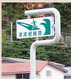
(Đường lánh nạn khi xảy ra Sóng thần)