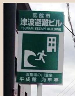
(Tòa nhà lánh nạn khi xảy ra Sóng thần)

Ở các khu phố, các tòa nhà cao tầng thường là nơi lánh nạn