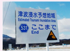
(Đến chỗ này là khu vực được dự báo sẽ ngập nước khi Sóng thần tràn vào)