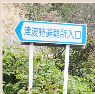
(Lối vào nơi lánh nạn khi xảy ra Sóng thần)

【Bảng hướng dẫn tòa nhà lánh nạn khi xảy ra Sóng thần】