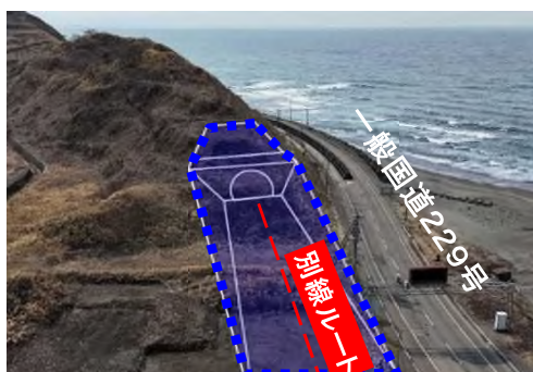
①鳥山トンネル北側坑口