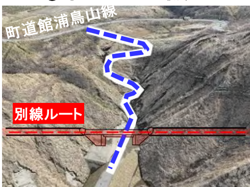
②工事用道路（山側の区間）