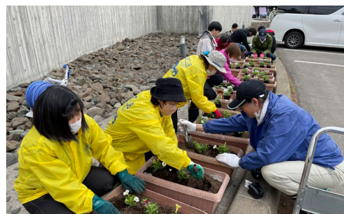
▲清掃活動終了後にプランターへの花植えを実施しました。