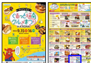
木古内小学校グラウンド 令和6年9月15日(日)