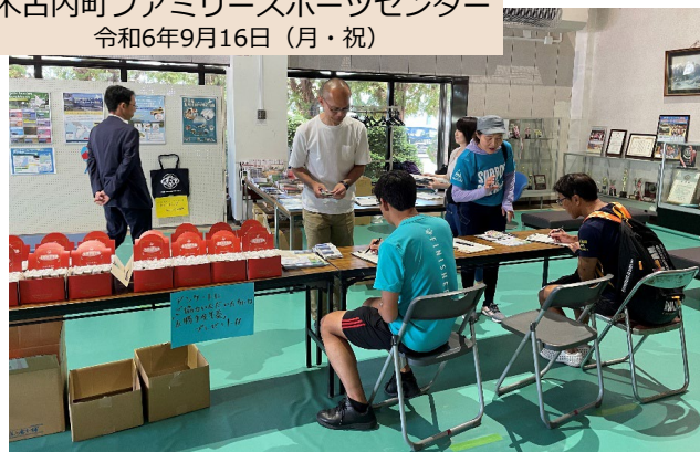
▲ アンケートにご協力いただいた方には「五勝手屋羊羹」をプレゼント