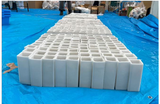
▲製作したキャンドル ※キャンドルに使用しているろうそくは100%植物性のものを使用しています。