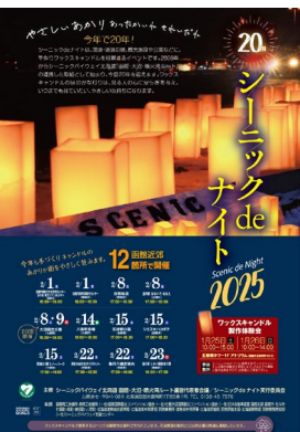
▲シーニックdeナイト2025 フライヤー

「函館・大沼・噴火湾ルート」では、2月1日から23日に開催予定のシーニックdeナイト2025で使用するワックスキャンドルの製作体験会が五稜郭タワー1Fアトリウムにおいて、令和7年1月25日(土)と1月26日(日)に開催されました。地域の皆さんや観光客など多くの皆さんにご参加いただき、道南12箇所を設置する約900個のワックスキャンドルを製作しました。当日の実施状況について、以下に報告いたします。