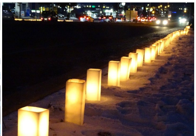
▲製作したキャンドルはシーニックdeナイト2025で使います。 ※写真はシーニックdeナイト2024の国道5号（函館新道）