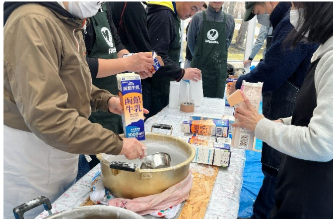
▲使用済み牛乳パックを利用してワックスを固めます。