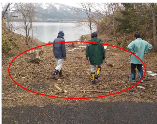
(応急措置実施前) 流木の堆積