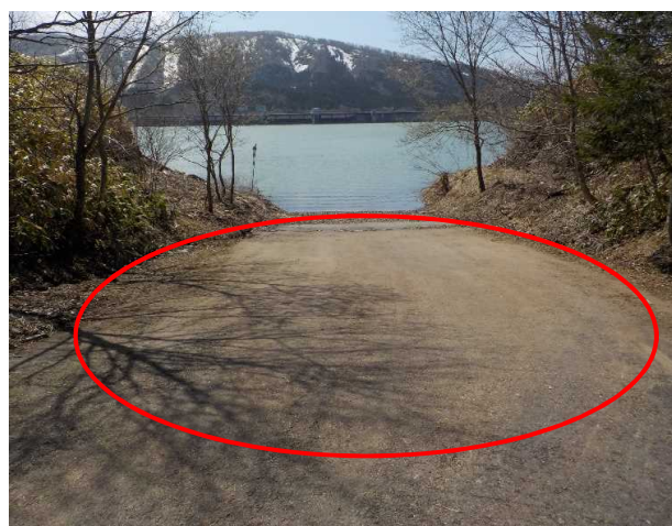
(応急措置実施後) 流木の撤去