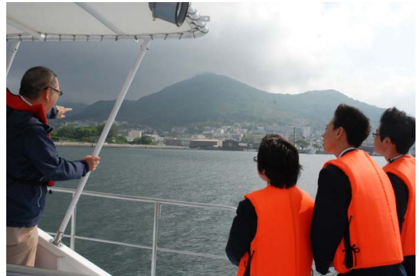
～港湾業務艇から函館港の役割を学習～