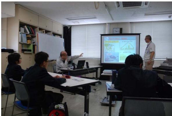
～函館港の歴史などを学習～