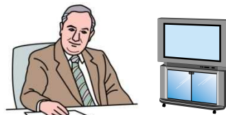
函館開発建設部長