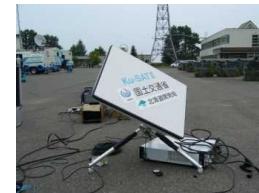
衛星小型画像伝送装置