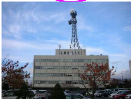
函館開発建設部(函館)