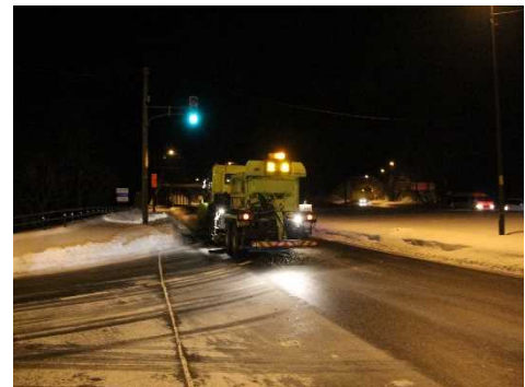
＜凍結防止剤散布車＞