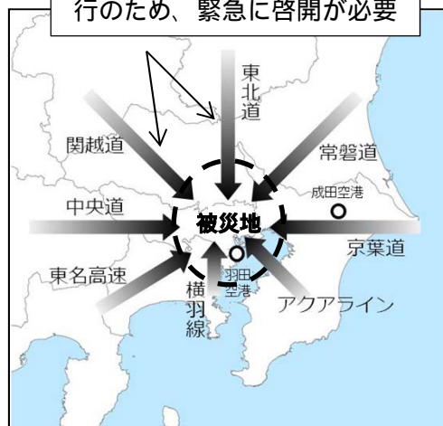
（首都直下地震における八方向作戦の例）