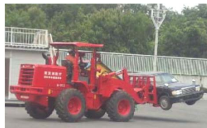
車両移動のための具体的方策 （例：ホイールローダーによる移動）