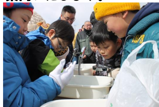
害虫を観察している様子