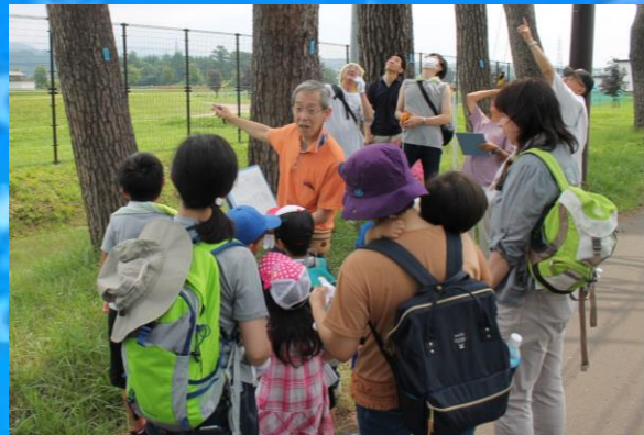
赤松を観察している様子

当日は、樹木医による、観察方法や七飯町の松についての説明を行いますので、初めての方や子ども連れの方も学習しながら参加できる観察会です。