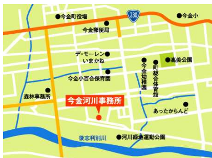
【職場体験集合場所 今金河川事務所】