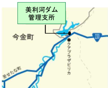
【職場体験場所 美利河ダム管理支所】