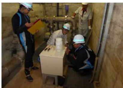
【監査廊の観測機器で点検】