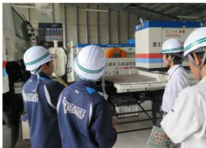
【災害対策車を見学】