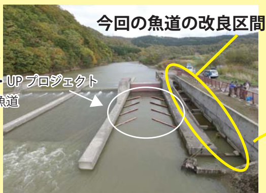
今回の魚道の改良区間