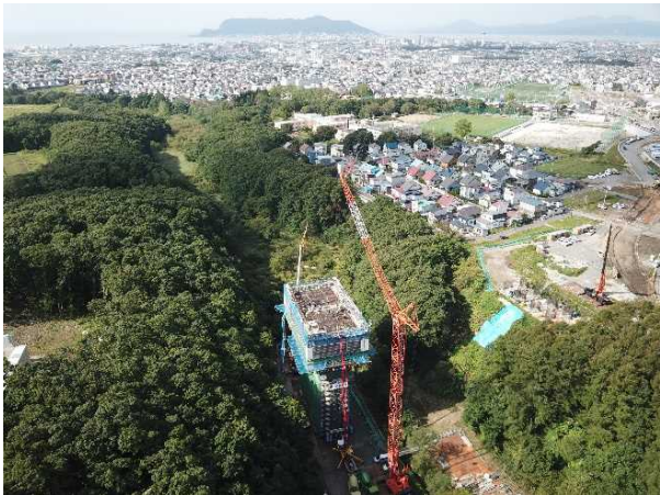
【湯の沢川橋の施工状況】