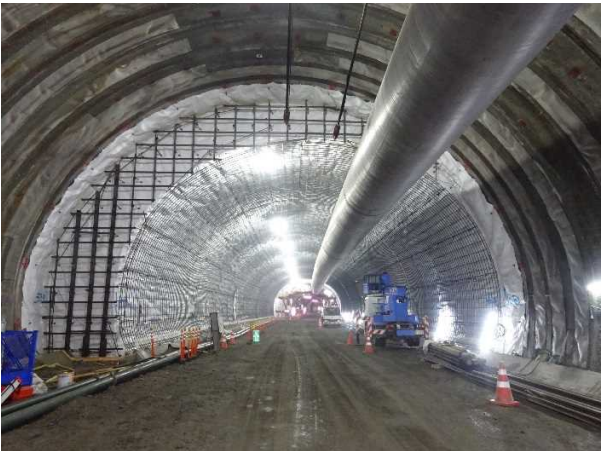
【見晴トンネルの施工状況】

函館新道、函館・江差自動車道と一体となって、道南圏から函館空港までのアクセス時間の短縮を実現するとともに、生活道路の渋滞緩和や物流・観光・地域産業への貢献が期待されます。