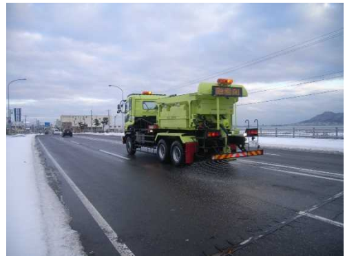
<凍結防止剤散布車>