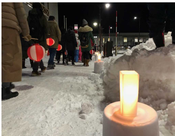
▲町内外からの参加者250名が、手作りのキャンドルが照らす駅前通りから佐女川神社まで練り歩きました。

昨年度の「どうなん・追分シーニックdeナイト」では、みそぎ祭りの2日目となる1月14日に町民の皆様がちょうちんを持って町内を練り歩くと『みそぎ行列』の実施に併せ、佐女川神社までの道のりに地元の方々が作成したキャンドルを並べ、祭りの夜をほのかに灯しました。