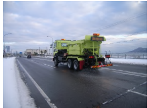
<凍結防止剤散布車>