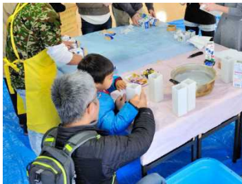
▲使用済み牛乳パックを利用してワックスを固めます。