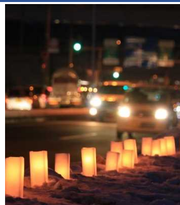
▲製作したワックスキャンドルはシーニックdeナイト2020で使用します。 ※写真はシーニックdeナイト2019の国道5号(函館新道)