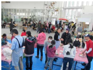
▲昨年は、地域の小学生の親子連れや観光客など約100名に参加いただき、約500個のキャンドルを製作しました。