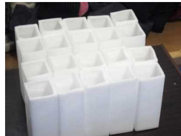
▲キャンドルに使用しているろうそくは100%植物性のものを使用しています。